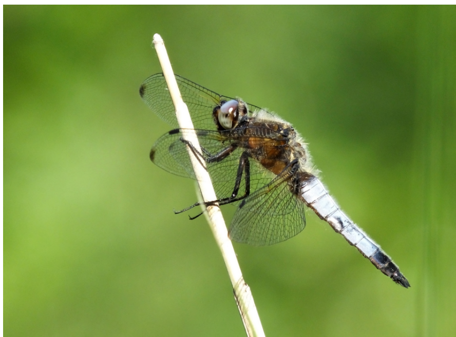
Männlicher Spitzenfleck ( Libellula fulva ) an der Alten Donau

Exkursionsleitung: Iris Fischer und Victoria Pail