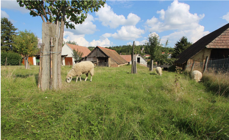
Abb. 1: Untersuchungsfläche mit Schaf- und Gänsebeweidung (12.9.2021). / Study area with sheep and goose grazing (12.9.2021).