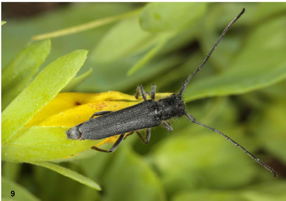
Abb. 8–9: (8) Ulmen-Wimpernböckchen ( Exocentrus punctipennis ); (9) Wachsbloemenböckchen ( Opsilia uncinata ).