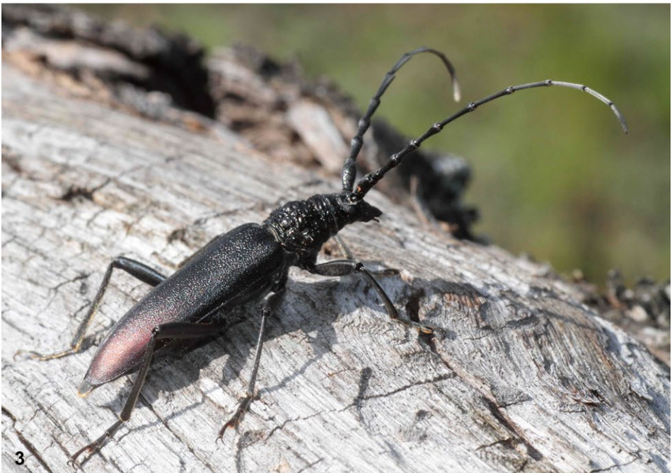
Abb. 2–3: (2) Breitschulterbock ( Akimerus schaefferi ); (3) Heldbock ( Cerambyx cerdo ).