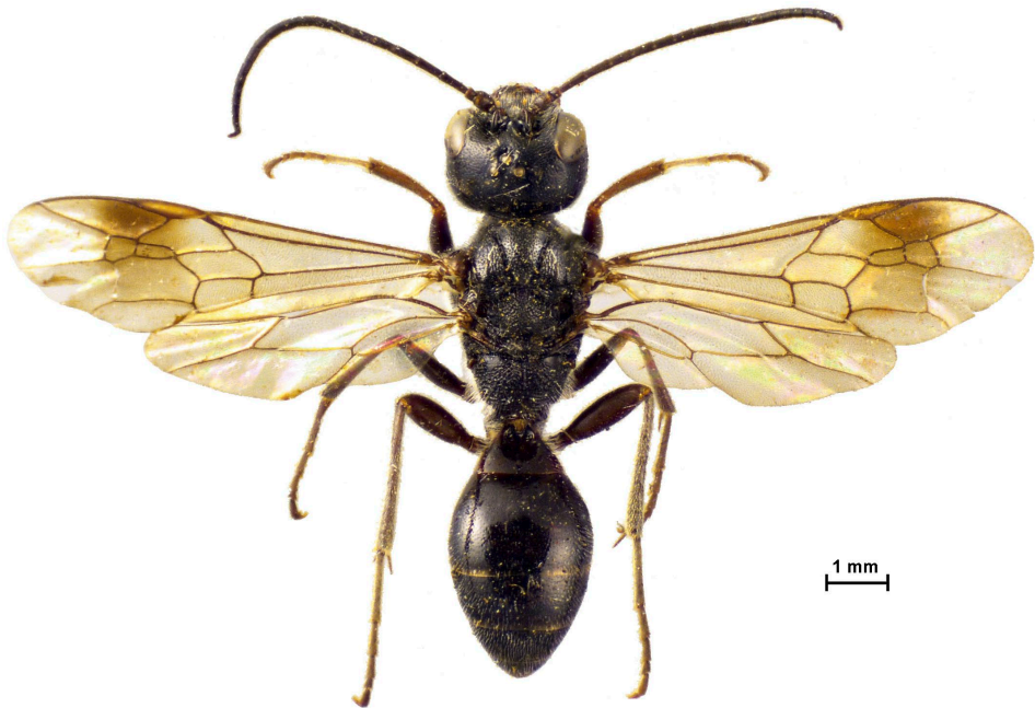
Abb. 1: Pseudogonalos hahnii , Weibchen / female.

1 ex. (CTK); Kaunerberg, NE Kauns, 1120–1200 m (47°04'N / 10°42'E), 11.VI.2005, leg. Martin Schwarz & M. Schwarz-Waubke, 6 ♂♂ (CMS, OLM); Fließ, Fließler Steppe, Neuer Zoll, Vögelebichl (47,116087 N / 10,626987 E), 1000 m, 5.VII.2014, leg. T. Kopf, 1 ex. (CTK) – Österreich, ohne genauere Funddaten, leg. A.F. Rogenhofer, 1 ♂ (NHMW).