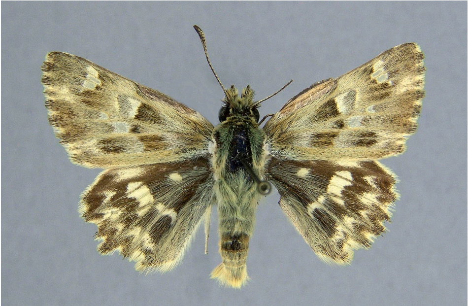
Abb. 1: Beleg eines Männchens des Bergziest-Dickkopffalter aus der Steiermark (Graz-Umgebung, leg. Ronnicke, LMK). / Male specimen of the Marbled Skipper from Styria (environment of Graz, leg. Ronnicke, LMK).

(SBN 1987, WEIDEMANN 1995, HÖTTINGER & PENNERSTORFER 1999, LAFRANCHIS 2000). Allerdings gibt es im Landesmuseum für Kärnten tatsächlich einige Belege von C. floccifera aus dem Sattnitz-Gebiet aus der ersten Hälfte des vorigen Jahrhunderts (pers. Beob.). Es ist anzunehmen, dass die wenigen vorhandenen Belege von C. lavatherae aus diesem Gebiet damals einfach für etwas ungewöhnlich gefärbte Exemplare von C. floccifera gehalten und in der Folge nicht mehr beachtet wurden.