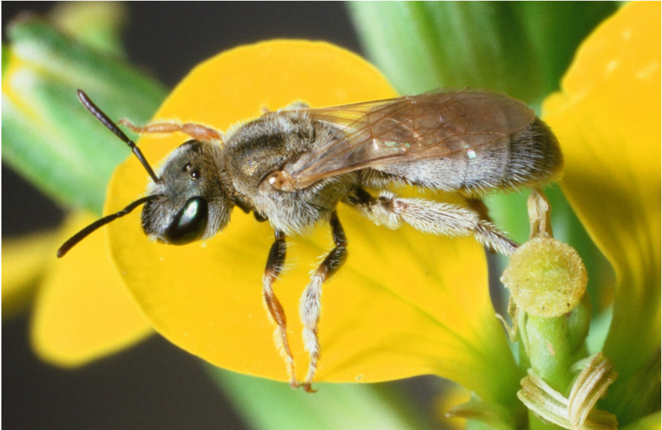
Abb. 7: Weibchen der Kleinen Filzfurchenbiene Halictus (Vestitohalictus) tectus RADOSZKOWSKI, 1875. / Female of Halictus (Vestitohalictus) tectus RADOSZKOWSKI, 1875.

2005a) geklärt. In Mitteleuropa im engeren Sinne (ohne dem Karpaten-Becken) gibt es von H. tectus somit Populationen im pannonischen Osten Österreichs und eine stabile Population in Südtirol (Vinschgau) (Ebmer, briefl.). Aus dem schweizerischen Wallis sind nach AMIET et al. (2001) und Ebmer (briefl.) nur historische Nachweise bekannt (letzter Fund 1967). Halictus vestitus ist hingegen rein westmediterran verbreitet und kommt in Österreich nicht vor.