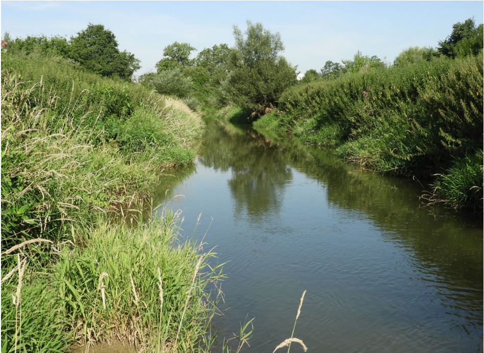
Abb. 11: Untersuchungsstrecke E, unterer Bereich, 25.7.2019. / Investigated stretch E, downstream section.