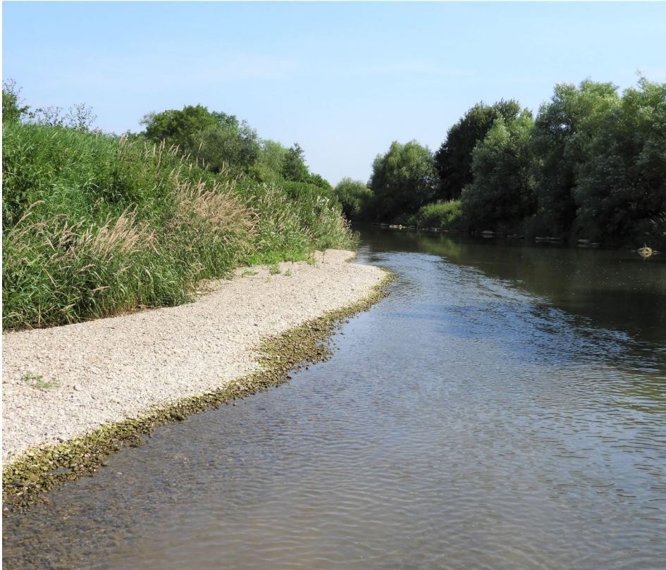
Abb. 2: Untersuchungsstrecke A bei niedrigem Wasserstand, 20.6.2019. / Investigated stretch A at low water level.