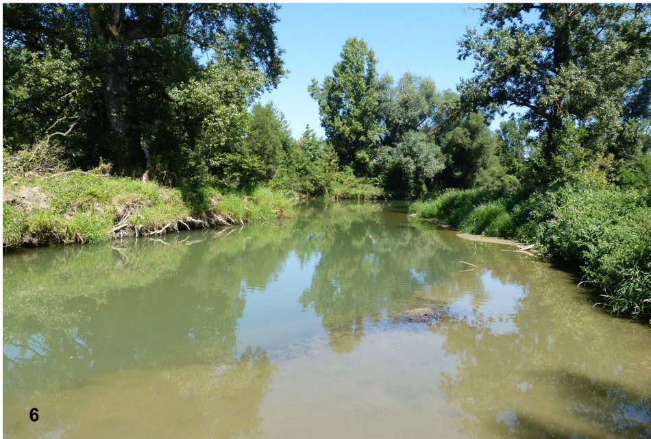
Abb. 5–6: Untersuchungsstrecke C mit (5) dichten Beständen von Ceratophyllum sp., 6.7.2019, (6) beginnender Entwicklung von Ceratophyllum sp.-Beständen, 2.8.2013. / Investigated stretch C with (5) stands of Ceratophyllum sp., (6) starting development of Ceratophyllum sp.