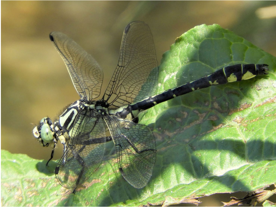
Abb. 17: Männchen von Gomphus vulgatissimus , 3.6.2019. / Male of Gomphus vulgatissimus .

gesichtet, die höchsten Individuenzahlen waren im Juli feststellbar (CHOVANEK 2019a). Die Populationsgröße im gesamten Untersuchungsgebiet wird auf deutlich mehr als 500 Individuen geschätzt.