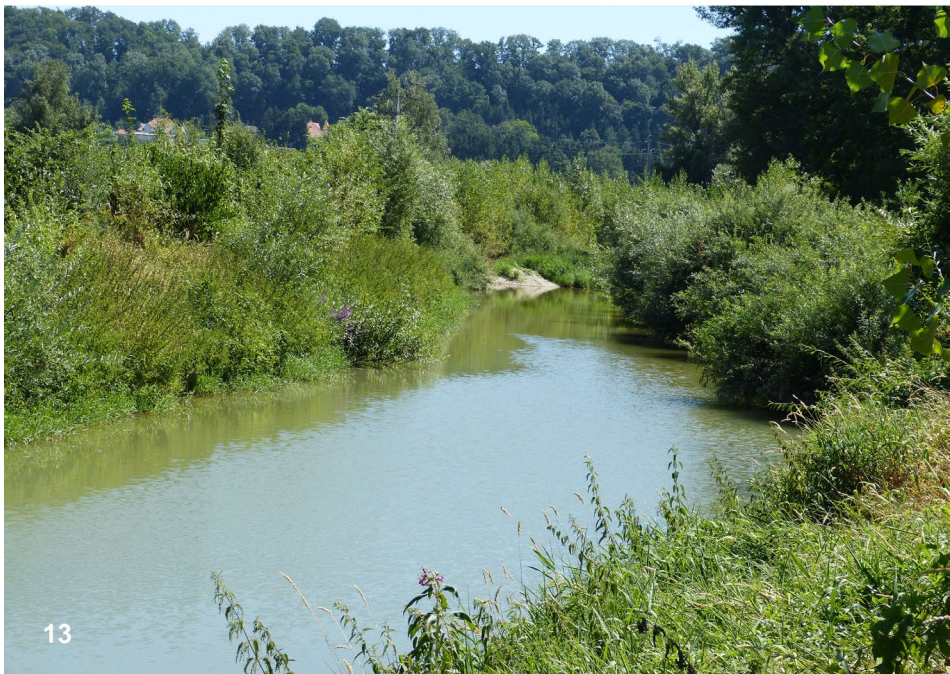
Abb. 12–13: Untersuchungsstrecke F (12) mit dichten Beständen aufschwimmender, submerser Makrophyten, 25.7.2019, (13) ohne flutende Makrophyten, 2.8.2013. / Investigated stretch F (12) with large mats of floating submerged macrophytes, (13) without floating macrophytes.