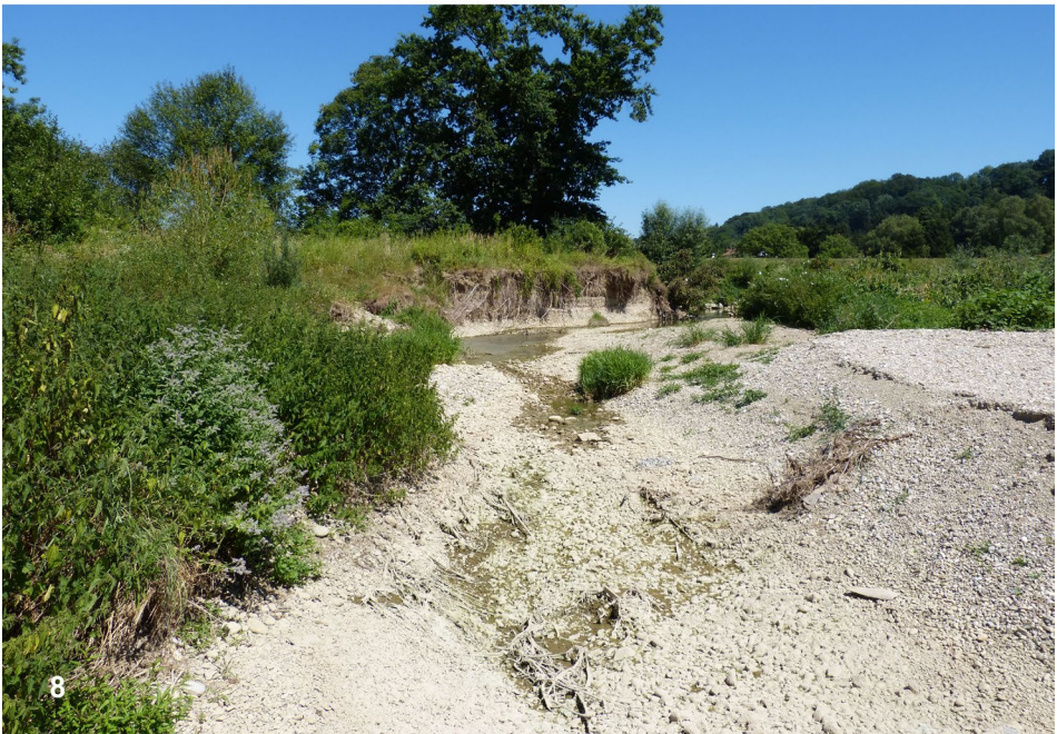
Abb. 7–8: Untersuchungsstrecke D (7) mit dem Hauptgerinne der Krems hydrologisch verbunden, 18.5.2019, (8) trocken gefallen, 2.8.2013. / Investigated stretch D (7) hydrologically connected with the main channel of the River Krems, (8) dried out.