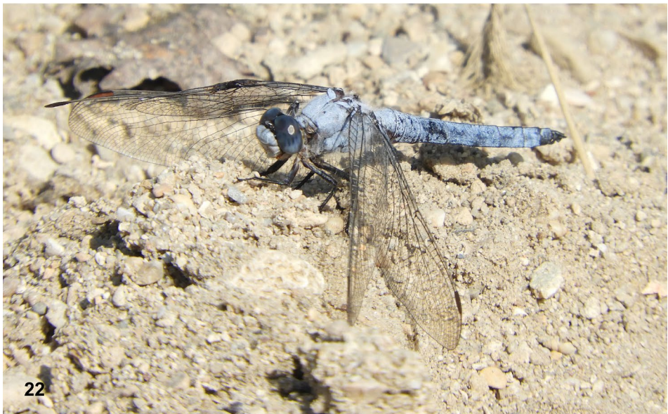
Abb. 21–22: (21) Kopula von Orthetrum albistylum, 6.7.2019, (22) Männchen von Orthetrum brunneum, 17.8.2019. / (21) Copula of Orthetrum albistylum, (22) male of Orthetrum brunneum.