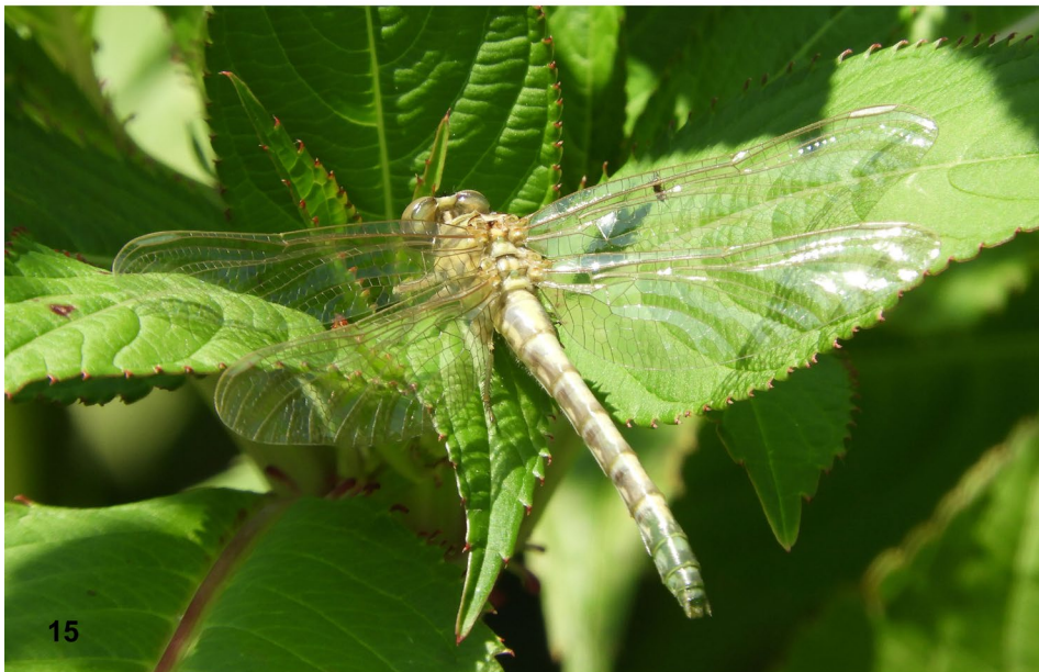
Abb. 14–15: (14) Männchen von Calopteryx splendens , 6.7.2019, (15) frischgeschlüpfte Weibchen von Onychogomphus forcipatus , 6.7.2019. / (14) Male of Calopteryx splendens , (15) freshly hatched female of Onychogomphus forcipatus .