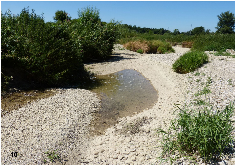
Abb. 9–10: Untersuchungsstrecke E, oberer Bereich (9) 6.7.2019, (10) trockengefallen, 1.8.2013. / Investigated stretch E, upstream section (9) 6.7.2019, (10) dried out, 1.8.2013.