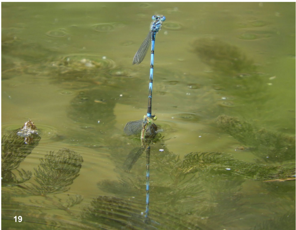
Abb. 18–19: Erythromma lindenii (18) Männchen, 6.7.2019, (19) Eiablage, 20.6.2019. / Erythromma lindenii (18) male, (19) oviposition.

Die Bewertung der homogenen Teilabschnitte zeigt folgendes Bild: Der libellen-ökologische Zustand des durch die Strecken A und B repräsentierten lotischen Abschnitts der Krems wurde mit „sehr gut“ klassifiziert, jener des linksufrigen, zweiseitig angebundenen Nebengerinnes (Strecken D und E) mit „gut“. Der einseitig angebundene Nebenarm (Strecke F) weist den „guten“, die Krems im Rückstaubereich (Strecke C) den „mäßigen libellen-ökologischen Zustand“ auf.