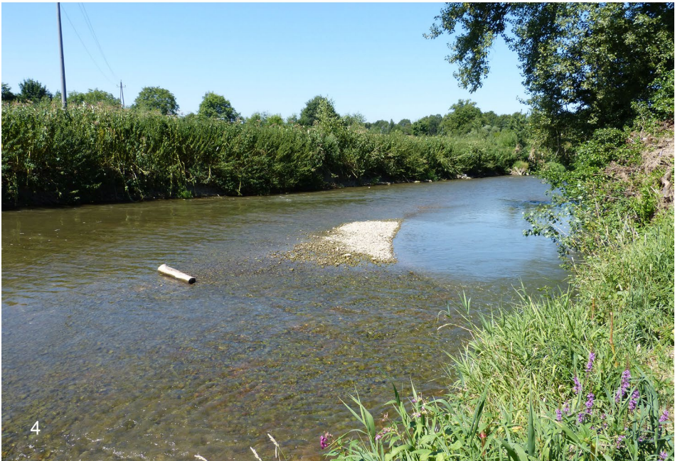
Abb. 3–4: Untersuchungsstrecke B mit (3) einer großen Kiesbank bei mittlerem Wasserstand, 18.5.2019, (4) beginnender Anlandung der Kiesbank, 1.8.2013. / Investigated stretch B with (3) a large gravel bank at medium water level, (4) starting gravel deposition.