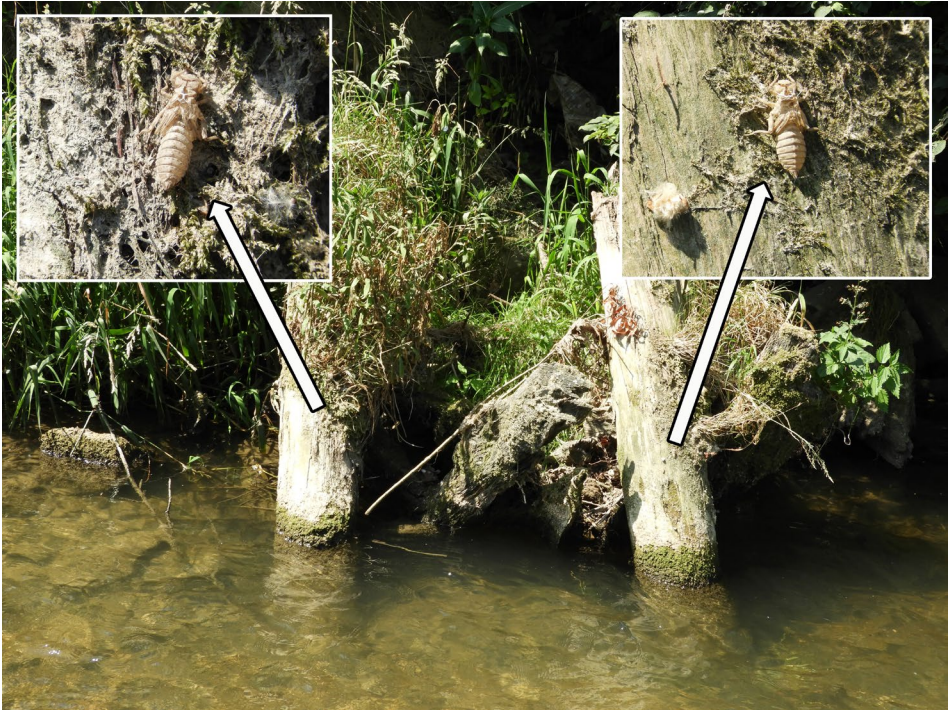
Abb. 16: Exuvien von Onychogomphus forcipatus an einer Wurzelstockbuhne (Strecke B), 20.6.2019. / Exuviae of Onychogomphus forcipatus at a rootstock-groyne (stretch B).

forcipatus waren an Strecke A am 6.7. (Abb. 15) und an Strecke E am 25.7. nachweisbar. Gomphus vulgatissimus trat an den Strecken A, B und E auf, an B und E sicher bodenständig. Sichtungen frischgeschlüpfter Individuen an den Strecken B und E und adulter Imagines (Abb. 17) erfolgten ausschließlich am 1.6. und 3.6. An den Strecken mit geringer oder fehlender Strömung (C und F) wurden keine Gomphiden gesichtet.