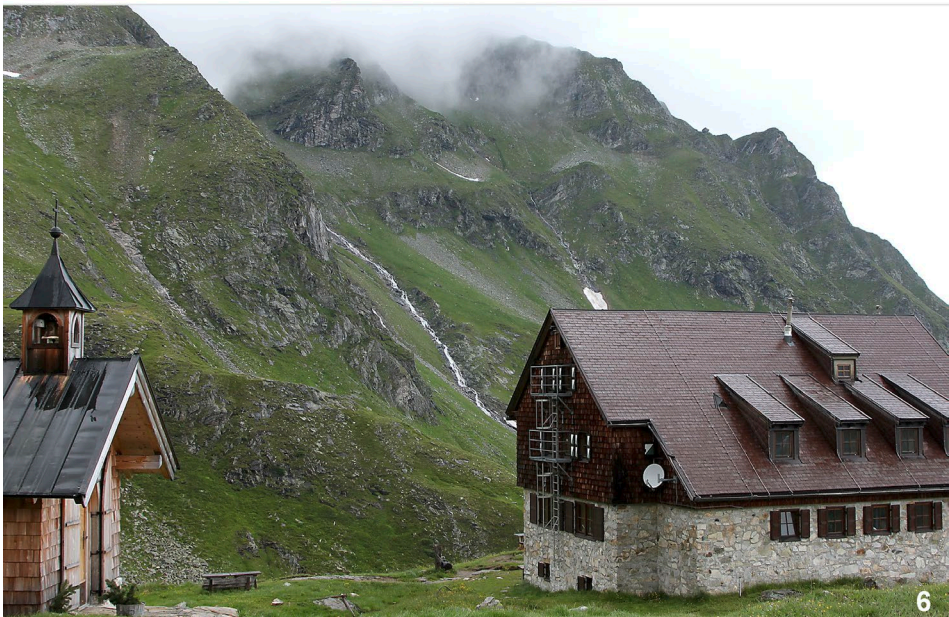
Abb. 5–6: (5) Alpine Rasen tauchen die bis in knapp 2800 m Seehöhe reichende Hochgebirgsflanke in saftiges Grün. (6) Die Fürther Hütte samt Kapelle auf 2200 m Seehöhe. / (5) Lush green alpine meadows cover the high alpine mountainside up to 2800m elevation. (6) The Fürther cabin and chapel at an elevation of 2200 m above sea level.

Nationalparks nicht vereinbar ist. Daran kann auch das Ausrufen eines auf ehrenamtlicher Tätigkeit basierenden „Tages der Artenvielfalt“ wenig ändern.