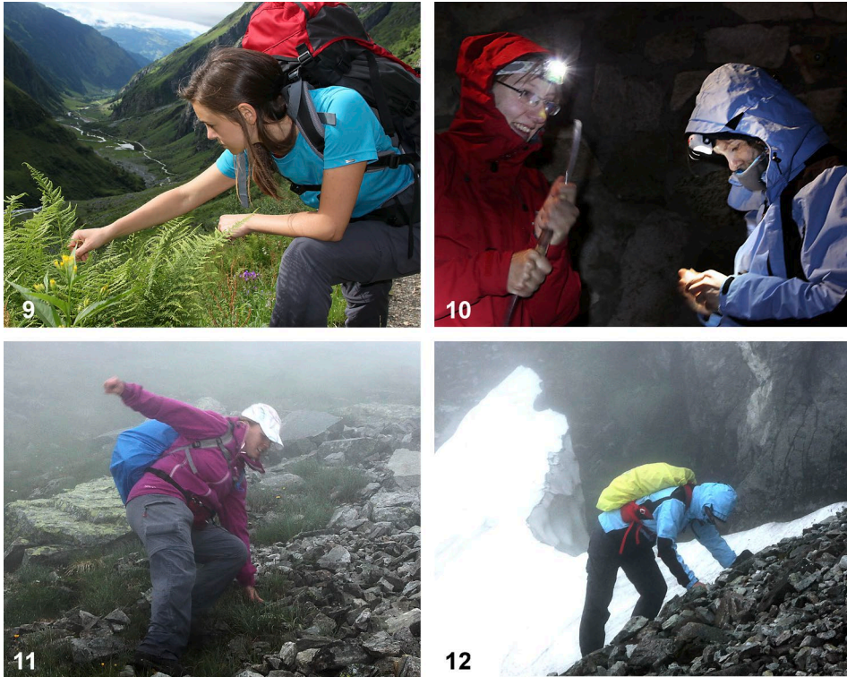
Abb. 9–12: Handfang (9) am Talschluss des Hollersbachtals, (10) mit Exhaustor rund um die Fürther Hütte, (11) in einer steilen Blockhalde bei Nebel oberhalb der Fürther Hütte und (12) auf 2200m Seehöhe am Rand eines Schneefeldes in der steilen Nordwand des Fürther Ecks. / Hand collecting (9) at the head of the Hollersbach valley, (10) with the exhaustor (aspirator) around the Fürther cabin, (11) at a steep, foggy scree slope above the Fürther cabin, and (12) at an elevation of 2200m at the fringe of a snow field in the steep north face of the Fürther Eck mountain.

wurden von Michael-Andreas Fritze, alle anderen Käfer von Sandra Aurenhammer und Erwin Holzer determiniert. Die Nomenklatur und Systematik der Käfer folgt der Online-Datenbank Fauna Europaea, Vers. 2.6.2 (ALONSO-ZARAZAGA & AUDISIO 2013), die der Laufkäfer MÜLLER-MOTZFELD (2006). Das Material befindet sich in der Sammlung des ÖKOTEAMs am Institut für Tierökologie und Naturraumplanung in Graz (Coll. OEKO), die Carabiden in der Coll. Fritze.