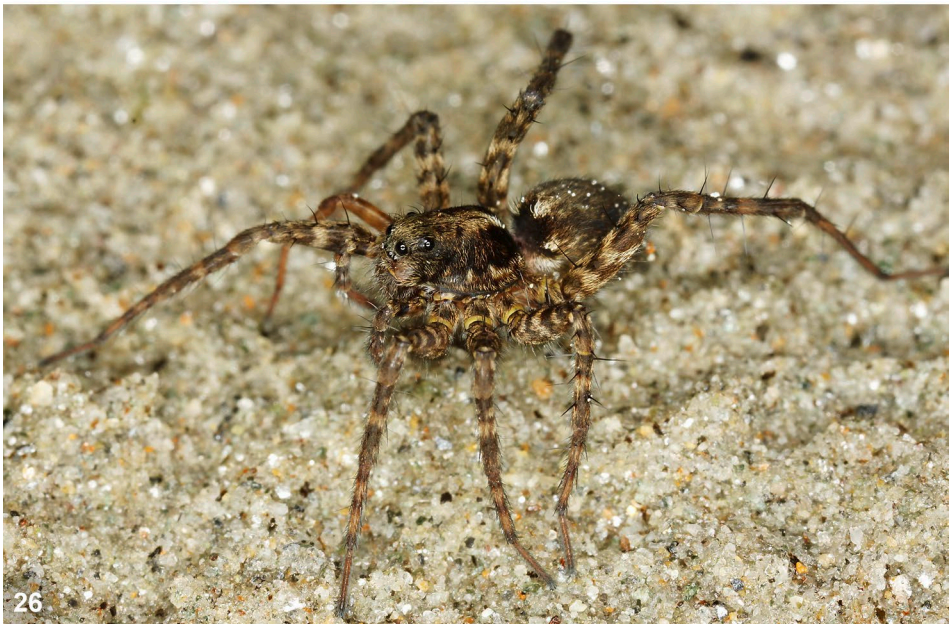
Abb. 25–26: (25) Die Wolfspinne Pardosa oreophila bewohnt alpine Rasengesellschaften und ist im Alpenraum im Westen wesentlich häufiger als im Osten. (26) Die häufige, hygrophile und euryzonale Wolfspinne Pardosa amentata steigt in den Alpen bis in die Alpinstufe auf. / (25) The wolf spider Pardosa oreophila inhabits alpine grasslands and is more common in the West than in the East. (26) In the Alps the common hygrophilous and euryzonal wolf spider Pardosa amentata rises up to the alpine zone.