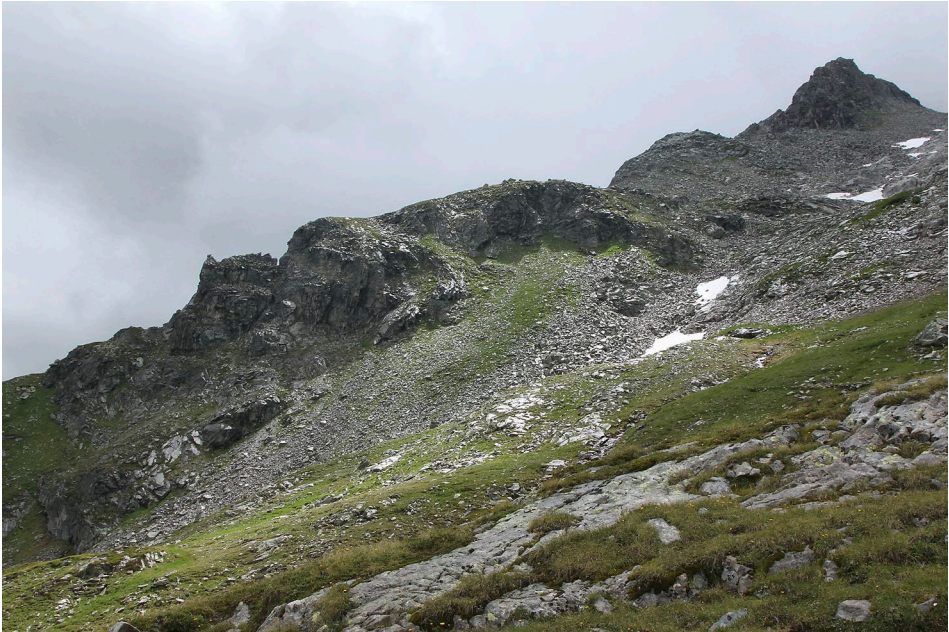
Abb. 7: Fels-, Block- und Schuttbiootope mit alpinen Rasen oberhalb der Fürther Hütte. / Rock and scree habitats with alpine meadows above the Fürther cabin.

Vom 13. bis 15. Juli 2012 fand der 6. Tag der Artenvielfalt im Nationalpark Hohe Tauern im Hollersbachtal, Salzburg statt. Den westlichen Tauerntälern zugehörig, stellt dieses Trogtal eben die Grenze des Untersuchungsgebiets der umfassenden zoologischen Kartierungen der Landtierwelt der Mittleren und Hohen Tauern durch FRANZ (1943) dar. Historische Daten zur Spinnentier- und Käferfauna des Tals lagen bis zum 6. Tag der Artenvielfalt nur vereinzelt vor. Für die Autoren war es eine schöne Gelegenheit, im Kreise von Gleichgesinnten und unter freundlicher Einladung von Kristina Bauch, Privatforschung im Salzburger Anteil des Nationalparks Hohe Tauern zu betreiben.