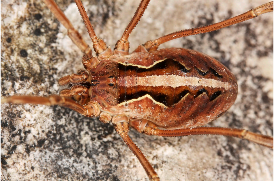
Abb. 30: Kein Fleckerl in höheren Lagen des Alpenraums, an dem der Gemeine Gebirgsweberknecht ( Mitopus morio ) nicht in hoher Anzahl zu finden ist. / No spot in the Alps located in higher altitude remains uninhabited by the abundantly occurring phalangiid Mitopus morio .

der hochalpinen Grasheidestufe gefunden werden. Der metallisch glänzende Schnellkäfer Selatosomus confluens besiedelt Lebensräume oberhalb der Baumgrenze und steigt bis in 3000 m Seehöhe; er ist besonders auf Urgestein zu finden (HORION 1953). FRANZ (1943) nennt die Art mehrfach für die Sonnblick-, Glockner-, Granatspitz- und Schobergruppe. Ein weiteres typisches Gebirgstier mit boreoalpiner Verbreitung ist der Tundra-Dickmaulrüssler ( Otiorhynchus nodosus ). Die nachtaktive Art lebt polyphag an Kräutern sowie an Laub- und Nadelbäumen. Zu ihrem Nahrungsspektrum zählen typische Gewächse der Zwergstrauchheiden wie Silberwurz, Steinbrech und Heidelbeere (RHEINHEIMER & HASSLER 2010).