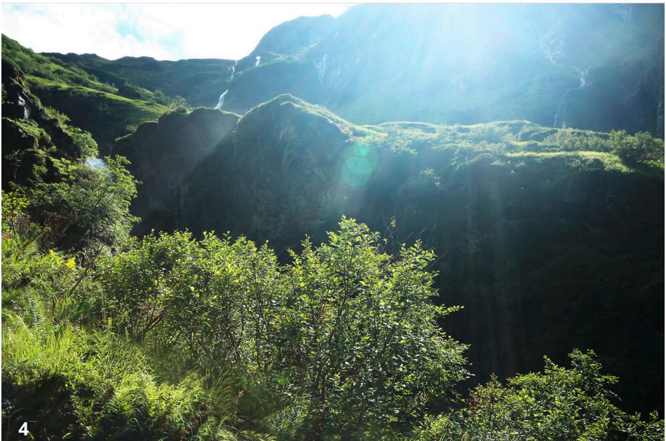
Abb. 3–4: (3) Schluchtabschnitt des Seebachs im Talschluss. (4) Der Talschluss ist von Grünerlenbeständen, Quell- und Hochstaudenfluren und Wasserfällen geprägt. / (3) Part of the Seebach gorge at the head of the valley. (4) The head of the valley is characterised by shrubs of green alder, tall herb vegetation and waterfalls.