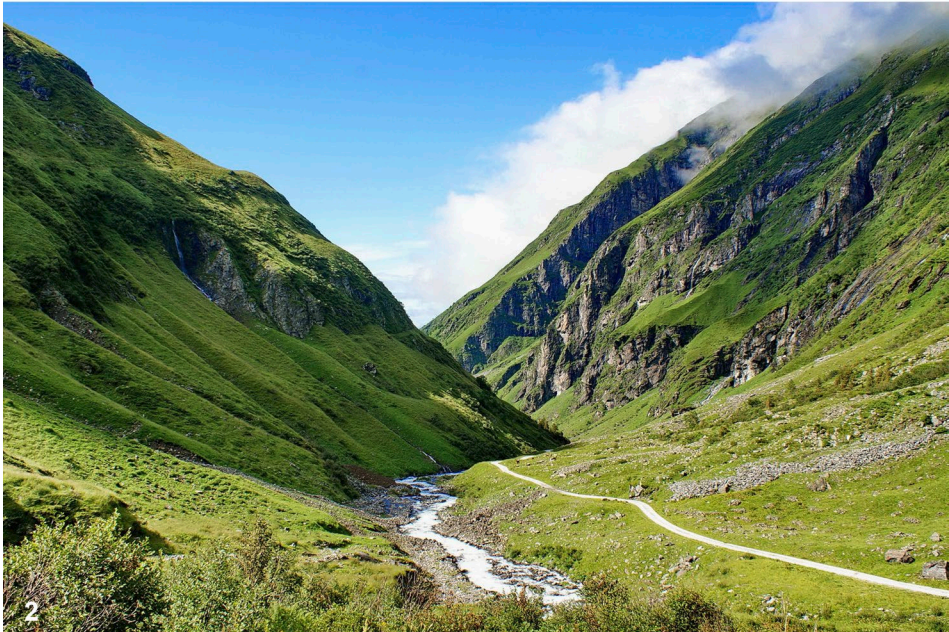
Abb. 1–2: (1) Felslandschaft hoch über dem Hollersbachtal im Nationalpark Hohe Tauern. (2) Blick vom Fuß der Materialeiseilbahn ins Hollersbachtal. Das Trogtal ist von zahlreichen natürlichen Still- und Fließgewässern durchzogen. / (1) Rocky landscape above the Hollersbach valley in the Hohe Tauern National Park. (2) View from the bottom end of the material ropeway into the Hollersbach valley. The trough valley is traversed by numerous natural standing and flowing waters.