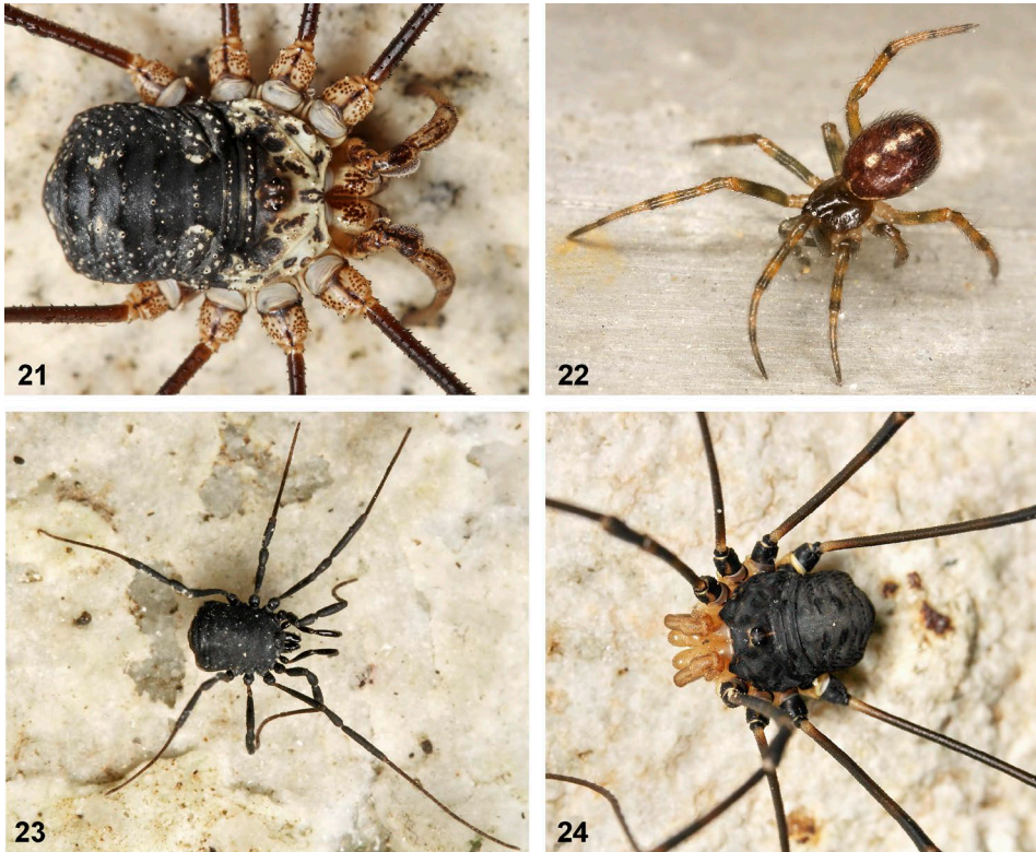
Abb. 21–24: (21) Der Gletscherweberknecht ( Mitopus glacialis ) ist ein anspruchsvoller Bewohner alpiner und nivaler Blockhalden. Obwohl einige Tiere an der steinernen Außenmauer der Fürther Hütte gefunden wurden, darf dieser Felsbewohner, der zur Nahrungssuche sogar auf Gletscher vordringt, keineswegs als synanthrop bezeichnet werden. (22) Die als synanthrop geltende Fettspinne ( Steatoda bipunctata ) konnte in mehreren Individuen an der Hüttenmauer nachgewiesen werden – in einer Entfernung von 12 Kilometern zur nächsten Ortschaft, Hollersbach. (23) Der kleinste Weberknecht im Gebiet, der Schwarze Mooskanker ( Nemastoma triste ), weiß sich unter Steinen in alpinen Rasen zu verstecken. (24) Ein Riese unter den Weberknechten ist diese Art mit dem treffenden wissenschaftlichen Namen Gyas titanus . / (21) The phalangiid Mitopus glacialis is a stenotopic species inhabiting alpine and nival screes. Although a few specimens were found on the stony outer wall of the Fürther cabin, this saxicolous harvestman, that even strives on glaciers in search for food, must not be referred to being synanthropic. (22) Several individuals of the synanthropic theridiid spider Steatoda bipunctata were found on the wall of the Fürther cabin, 12 kilometres from the next village, Hollersbach. (23) Nemastoma triste is the smallest harvestman in the area and hides under stones in alpine meadows. (24) A giant among harvestmen is this species with the sounding scientific name Gyas titanus .