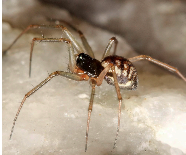
Abb. 16: Die Baldachinspinne Tenuiphantes jacksonoides ist ein Ostalpen-Endemit und eine Charakterart subalpiner und alpiner Grasheiden und Blockhalden. / The linyphiid Tenuiphantes jacksonoides is endemic to the Eastern Alps and a character species of subalpine and alpine grass heaths and screes.

lebensräumen zu finden (KOMPOSCH 2009c). Als euryzonale Spezies tritt sie von Alluvionen der Talräume bis ins Gletschervorfeld auf. Der aktuelle Fund im Hollersbachtal gelang in einer Silikatblockhalde in 1250 m Seehöhe nordwestlich der Schuhbichlalm und liegt an der derzeit bekannten Ostgrenze des Areals dieser natur-schutzfachlich wertvollen Spezies. Nachweise aus dem Nationalpark Gesäuse (ZULKA 2013) werden zur Zeit genetisch überprüft.