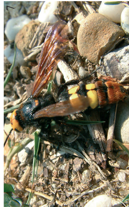
5: Colpa sexmaculata, Weibchen, Alberese/Maremma in Italien, 24.09.2004 ; 6: Colpa sexmaculata, Männchen, Alberese/Maremma in Italien, 20.09.2005 ; 7: Megascalotia m. maculata, Weibchen, Dune de Pyla in Frankreich, VII/2003 ; 8: Megascalotia m. maculata, Weibchen, typische Kopfzeichnung, Dune de Pyla in Frankreich, VII/2003