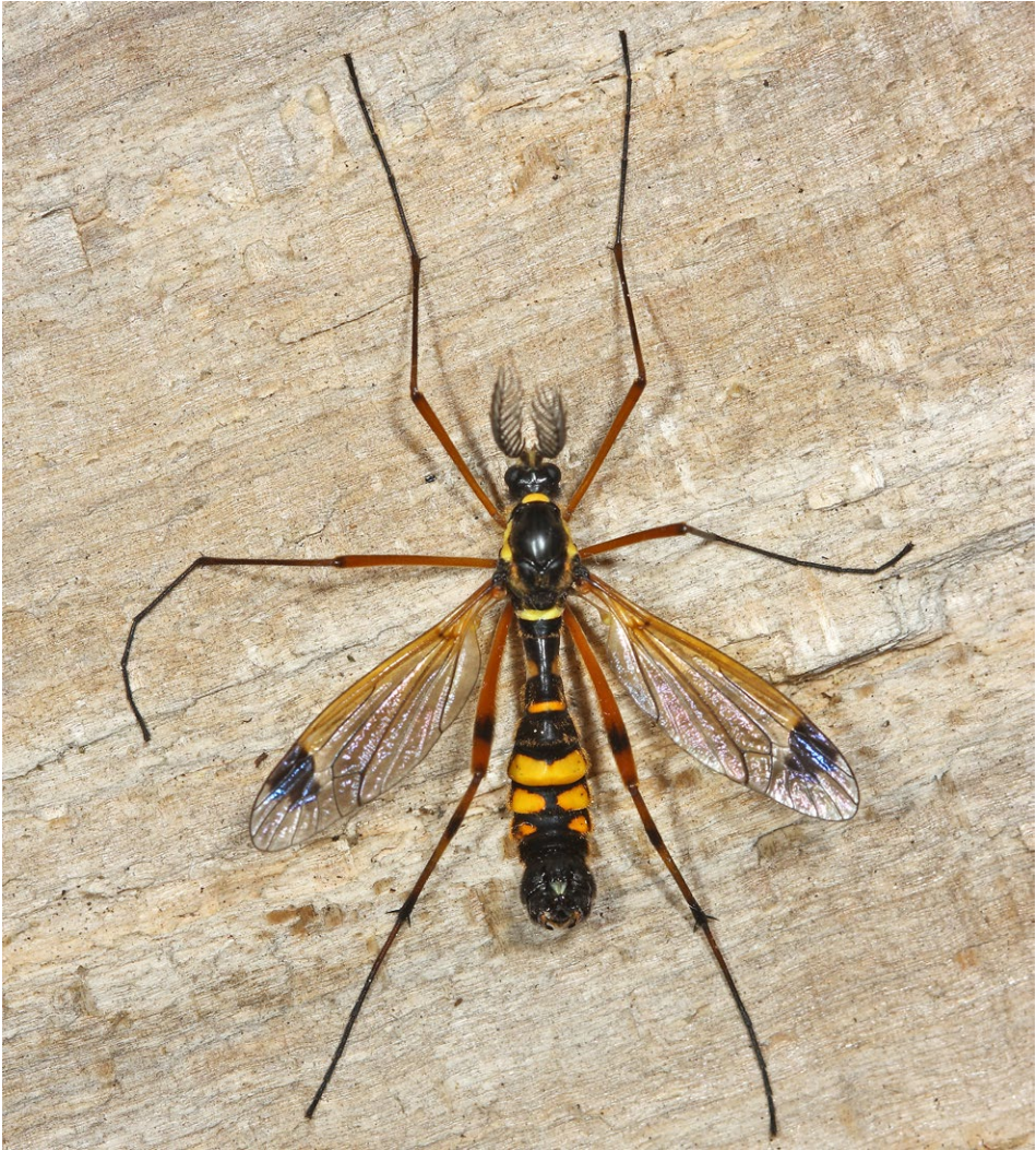
Abb. 1: Ctenophora ornata , Männchen. / Male.

1 ♂, und leg. F. Pühringer, 1 ♂, 2 ♀♀, coll. OÖLM; Teischnitztal, Pifanghütte, N47°02,5', E12°40,1', 2220 m SH, 9.VII.2011, 1 ♀, Lichtfalle, leg. N. Pöll, coll. OÖLM. – Kartitsch: Winklertal, am Wasserfall, N46°41,9', E12°29,6', 1700 m SH, 27.VII.1983, 1 ♂. – Lienz-Stadt: Friedenssiedlung, 2.VII.2008, 1 ♂. – Nikolsdorf: N46°47', E12°54,5', 670 m SH, 27.10.1979, 1 ♀. – Obertilliach: Leitnertal, N46°43', E12°34', 1480 m SH, 29.VI.2000, 1 ♂.