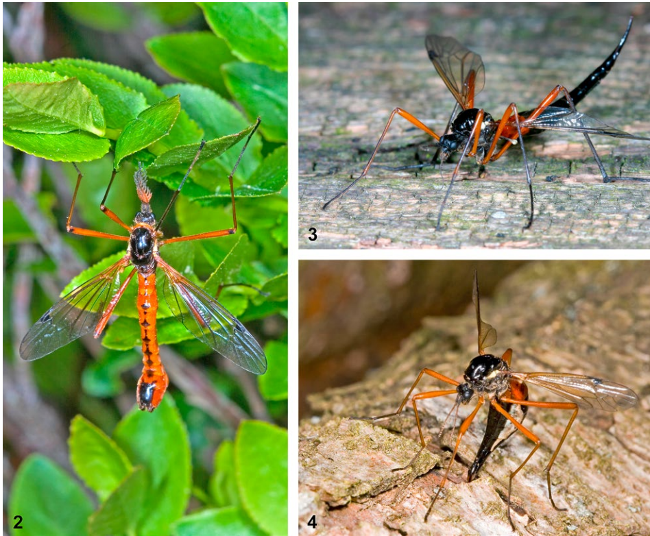
Abb. 2–4: Tanyptera atrata : (2) Männchen; (3) Weibchen; (4) Weibchen bei der Eiablage in morsches Holz. / Tanyptera atrata : (2) male; (3) female; (4) female laying eggs in rotten wood.