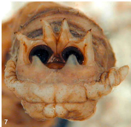
Abb. 5–7: (5) Ein Weibchen von Tipula (Lunatipula) sp. bei der Eiablage in den Boden. (6) Imago von Tipula paludosa . (7) Larve von T. paludosa , Hinterende. / (5) A female of Tipula (Lunatipula) sp. during oviposition into the soil. (6) Imago of Tipula paludosa . (7) Larva of T. paludosa , posterior part.

Tipula subcunctans fliegt spät im Herbst und ist in Österreich nur von wenigen weiteren Fundorten bekannt, jedoch aus sehr unterschiedlichen Höhenlagen (in den Öztaler Alpen auf 2000 m und am Neusiedlersee auf 115 m Seehöhe). In der nördlichen Paläarktis ist sie häufig und weitverbreitet von Nordeuropa bis Ostasien.