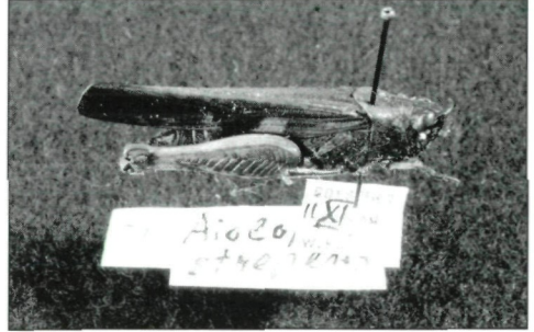
Abb. 2: Aiolopus strepens ♀, 11.11.1950, Graz-Gösting, Steiermark