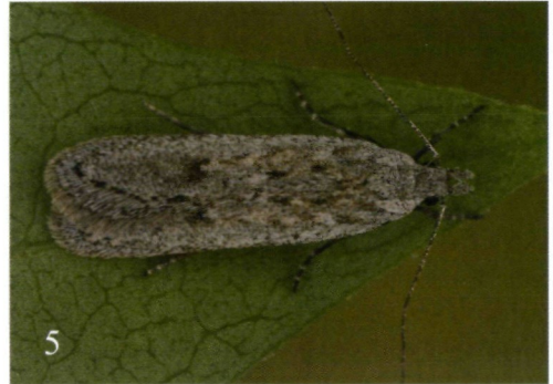
Abb. 1: Syncopacma ochrofasciella, ♂, 29. 5. 2004 Abb. 2: Cacoecimorpha pronubana, ♂, 29. 9. 2004 Abb. 3: Blastobasis huemeri, ♀, 8. 8. 2004 Abb. 4: Eteobalea intermediella, 30. 8. 2004 Abb. 5: Gelechia asinella, ♀, 15. 7. 2004 Abb. 6: Genitalpräparat Syncopacma ochrofasciella