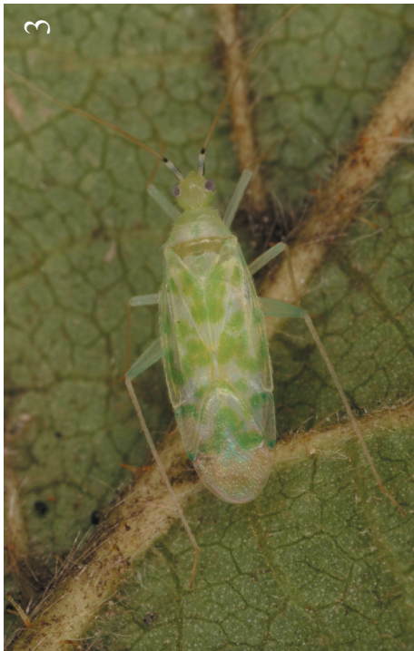
Tafel/Plate 1: (1) Bothynotus pilosus (BOHEMAN, 1852), (2) Trigonoyilus pulchellus (HAHN, 1834), (3) Malacocoris chlorizans (PANZER, 1794), (4) Hoplomachus thunbergii (FALLEN, 1807).