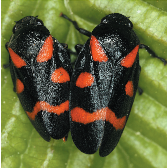
Abbildung 15: Bindenblutzikade Cercopis sanguinolenta (SCOPOLI, 1763) in Kopula.