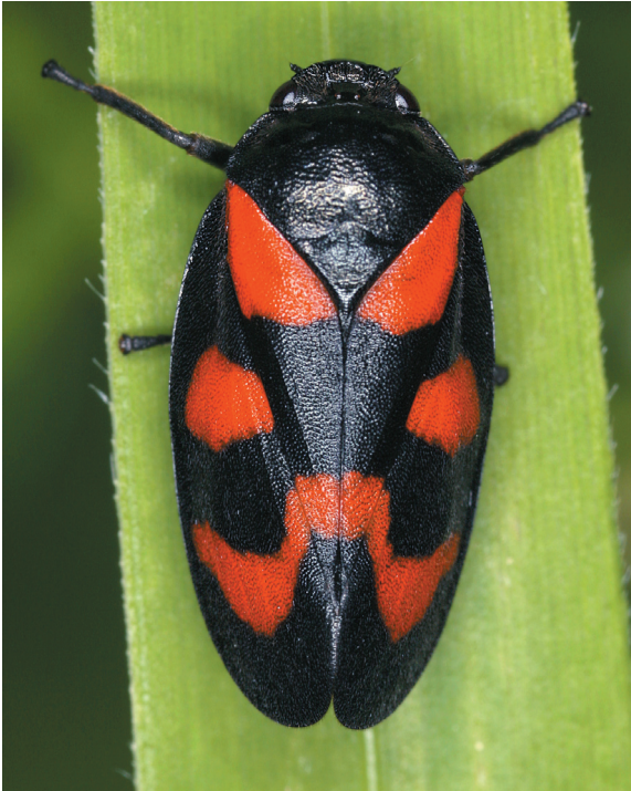
Abb. 1: Die Gemeine Blutzikade ( Cercopis vulnerata Rossi, 1807) – das Insekt des Jahres 2009.