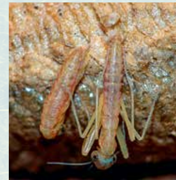
Abb. 5: Schlüpfende, wurmähnliche Prälarve (links) neben einer Larve im 1. Stadium.

Um sich zu einer ausgewachsenen Gottesanbeterin zu entwickeln, müssen sich die Larven, je nach Klima und Nahrungsangebot, sechs- bis siebenmal häuten. Während dieser Entwicklung kann die Gottesanbeterin ihre Färbung der Umgebung anpassen und so Körperfärbungen von einem hellen Beige, über diverse Brauntöne bis zu einem satten Grün annehmen.