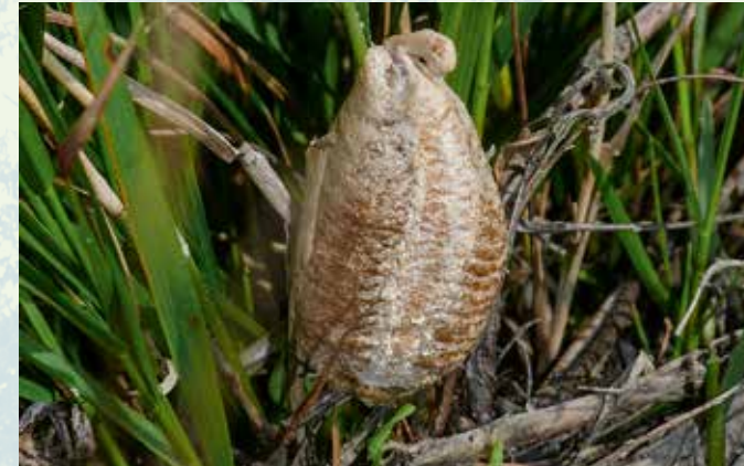
Abb. 4: Oothek, abgelegt an einen Grashalm.

In den Monaten August bis Oktober produzieren die Weibchen mehrere Eigelege, die sogenannten Ootheken. Mit dem Hinterleibsende schlagen die Weibchen ein körpereigenes Sekret zu Schaum, der als Baustein für diese ausgeklügelte Konstruktion dient.