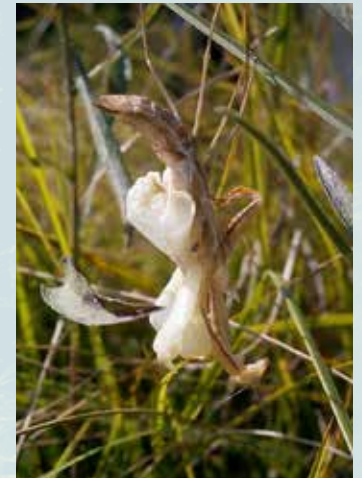
Abb. 7: Weibchen während der Adult-Häutung.