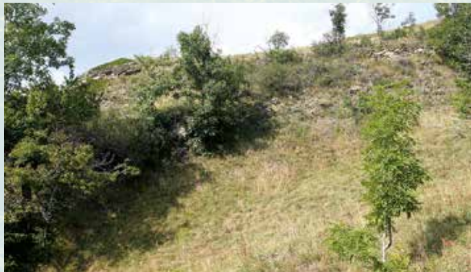
Abb. 2: Das höchstgelegene Mantis religiosa -Habitat Mitteleuropas in der Schweiz bei Visperterminen auf über 1450 m NN.

Als Linnaeus 1758 der Gottesanbeterin den wissenschaftlichen Namen Mantis religiosa gab, übernahm er das altgriechische Wort μαντις (mantis), was Seher oder Wahrsager bedeutet.