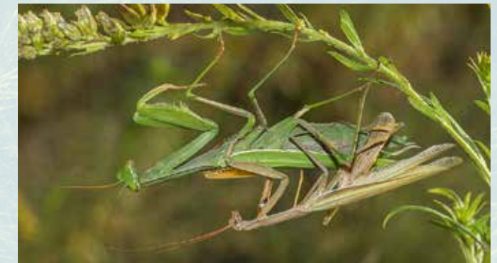
Abb. 8: Männchen und Weibchen bei der Paarung (Kopula).