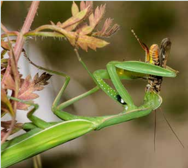
Abb. 9: Grünes Weibchen beim Verzehr einer Heuschrecke.

Durch ihre räuberische Lebensweise hat die Gottesanbeterin in Ökosystemen eine regulierende Aufgabe. Gleichzeitig ist sie, vor allem als Larve, auch Nahrung und somit Lebensgrundlage für zahlreiche andere Tiergruppen wie Spinnen, Eidechsen, Vögel und Kleinsäuger. Zudem haben sich, trotz des guten Schutzes der Eier in der Oothek, einige parasitoide Hautflügler auf eine Eiablage in die Gottesanbeterinnen-Eier spezialisiert.