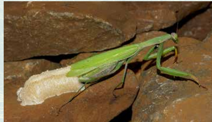
Abb. 3: Weibchen bei der Ablage einer Oothek auf Schottergestein.

Die Gottesanbeterin wird in fast allen Roten Listen Deutschlands, Österreichs und der Schweiz als bedrohte Art geführt. Ob dies unter Berücksichtigung der aktuellen Arealausweitung überall noch berechtigt ist, kann hinterfragt werden.