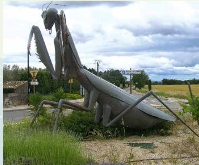
Abb. 10: Diese Mantis religiosa aus Metall steht auf einer Verkehrsinsel im Ort Sériignan du Comtat in Frankreich. In diesem Ort befindet sich der letzte Wohnort und das Museum des Insektenforschers Jean-Henri Fabre.