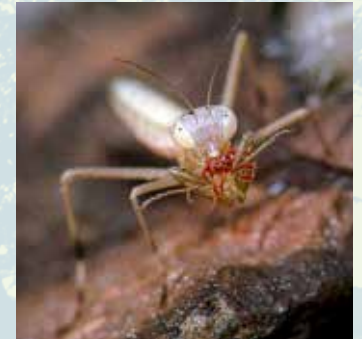
Abb. 6: Junge Larve bei der Nahrungsaufnahme.

In der kälteren werdenden Jahreszeit sterben dann die ausgewachsenen Tiere, nur ihre Eier überdauern den Winter im Schutz der Ootheken.